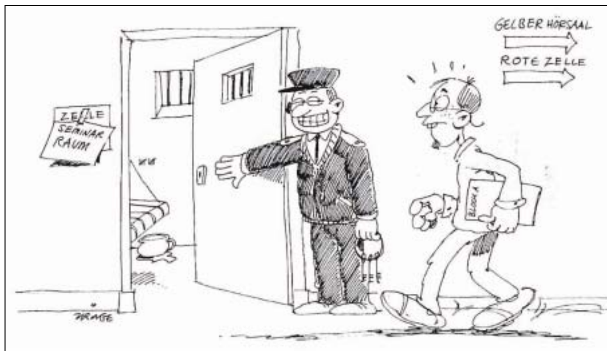
Unibetrieb 2011 im Knast am Unteren Schloss: „Freiheit! Und hierfür Studiengebühren“. WP-Karikatur: M. Krings

□ Für Februar 2008 wurde ein Projekt von der Deutschen Forschungsgemeinschaft bewilligt. Dabei treffen sich zwölf internationale Wissenschaftler zu fünf Tagungen in Siegen. Dabei wird das Thema „Wahrnehmung des Guten, Schönen und Heiligen“ im Mittelpunkt stehen. □ Die Philosophen können auch fünf Reisestipendien für ausländische Studierende vergeben. Sie kommen u.a. aus den USA, Brasilien und Chile.